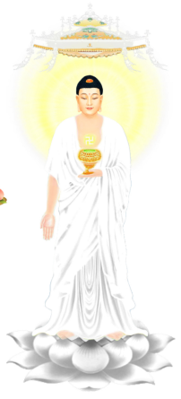
DI ĐÀ THIÊN