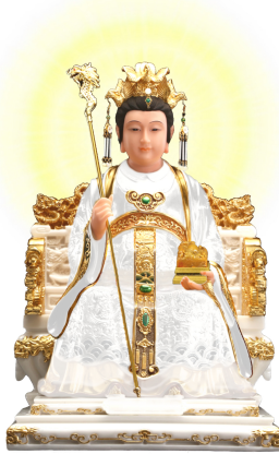
VÔ CỤC MẪU THIÊN