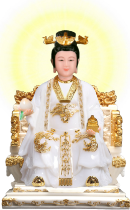
ĐIỀU TRỊ MẪU THIÊN