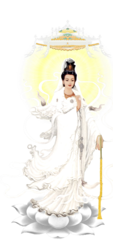
QUÁN ÂM THIÊN