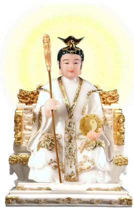
TIÊN ĐỊA MẪU THIÊN